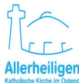
Allerheiligen Katholische Kirche im Ostend

Haftpflicht- und Unfallversicherung für die Helfer und Helferinnen werden vom Hilfenetz abgeschlossen.